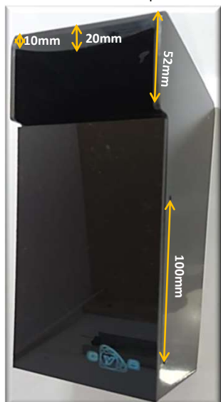
Vista General del Componente